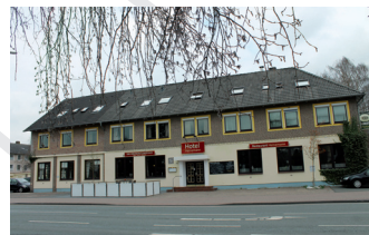
Das Hotel Heinemann in der Klingenbergstr. 51.

Das **S-Komfort Hotel hat einiges zu bieten und möchte Sie gerne überzeugen, einmal eine Nacht in einem der hochwertigen Zimmer zu verbringen. Es gibt nicht nur Doppel-, Einzel- und Familienzimmer, zusätzlich werden Betten mit Überlänge angeboten – nie wieder mit angewinkelten Beinen schlafen! Nicht nur komfortable Nächte, auch eine umfangreiche Küche gehört zum Repertoire von Hotel Heinemann. Genießen Sie saftige Steaks, klassische Currywurst, vielfältige Salate, deftige Omelettes und verführerische Desserts im stilvollen Restaurant des Hauses. Oder fragen Sie doch einfach mal nach dem „Kulinarischen Abend“: ein genussvoller Abend, der immer unter ein bestimmtes